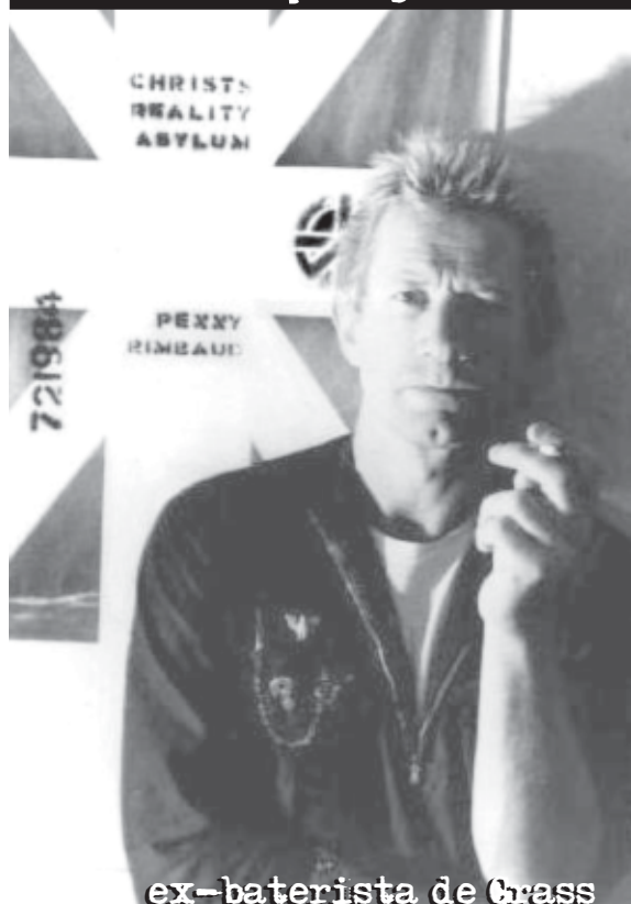
ex-baterista de Crass